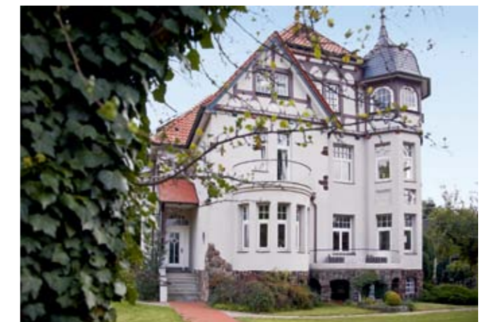
MOON GMBH, IM KLINT 12, 30938 BURGWEDEL TELEFON: 00 49 - 51 39 - 95 14 - 100 (Mo. – So. 6.00 – 23.00 UHR) INTERNET: WWW.MOON.COM